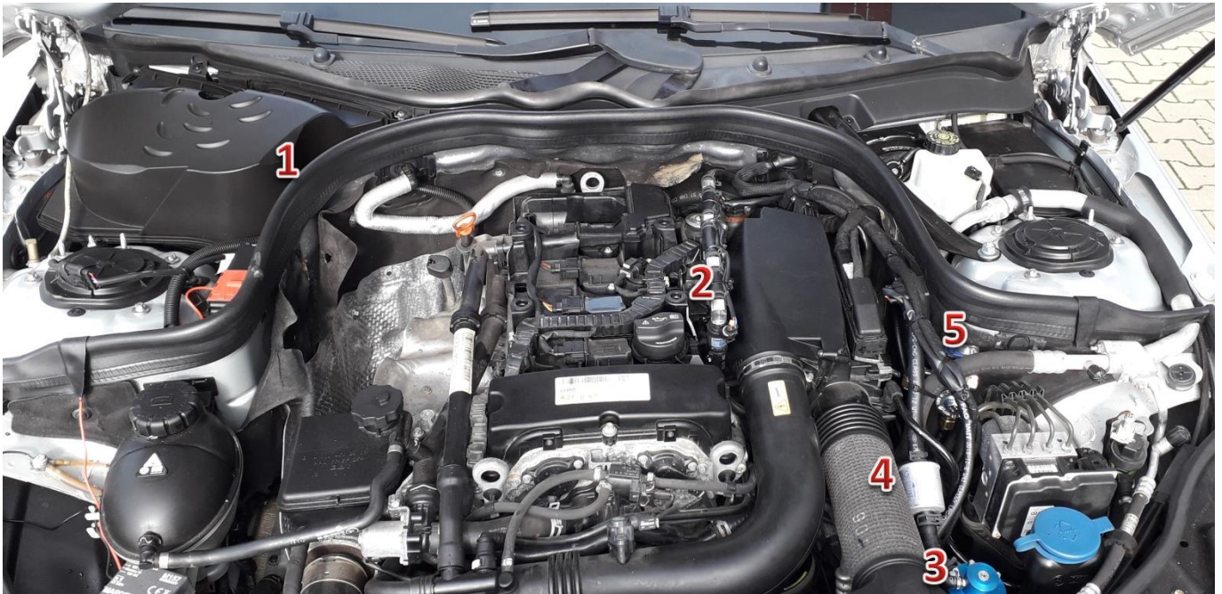
1-sterownik/ECU Zenit Direct, 2-wtryskiwacze gazu/gas injectors, 3-reduktor/reducer, 4-filtr fazy lotnej/gas phase filter, 5-elektrozawór z filtrem fazy ciekłej/electrovalve with liquid gas phase filter